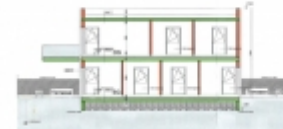
SCHNITT A-A M 1:100