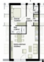
HAUS A - TOP 1 EG 225.000,-