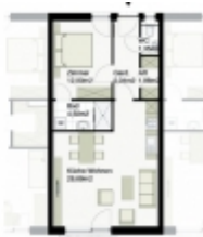
HAUS A - TOP 3 EG 160.000,-