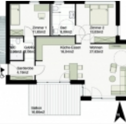
HAUS A - TOP 6 1. OG 172.000,-