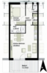
HAUS B - TOP 4 1. OG 275.000,-